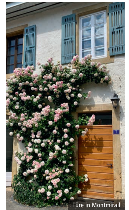
Türe in Montmirail

Anmeldung und Auskünfte: Bis am 16. Februar 2024 an: Ursula Zwahlen, u.zwahlen@gmx.net oder Sabine Schiess, sabine@himmelblau.ch